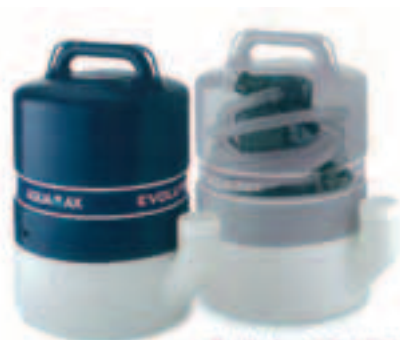
Evolution 10 (10 lt)