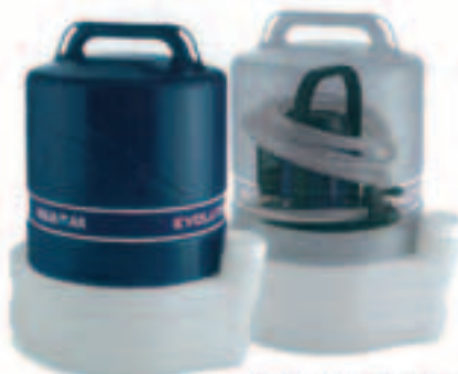
Evolution 20 (20 lt)