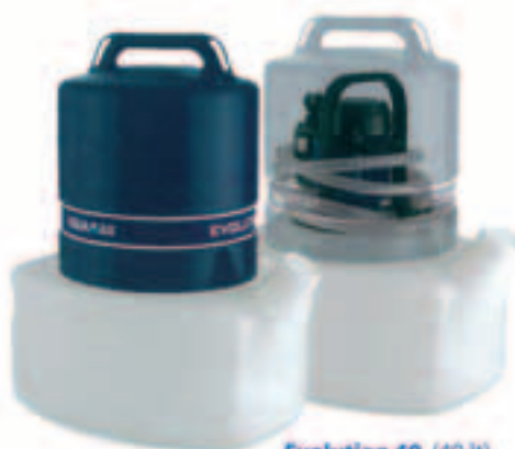
Evolution 40 (40 lt)

Rense og sirkulasjonspumper Descaling pumps